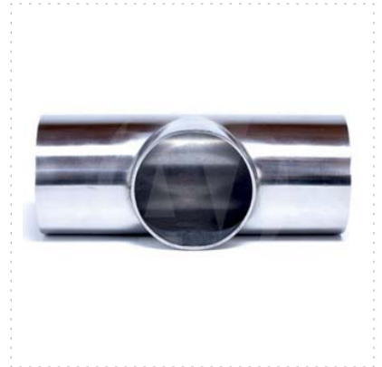
Corte Axial Pieza Completa